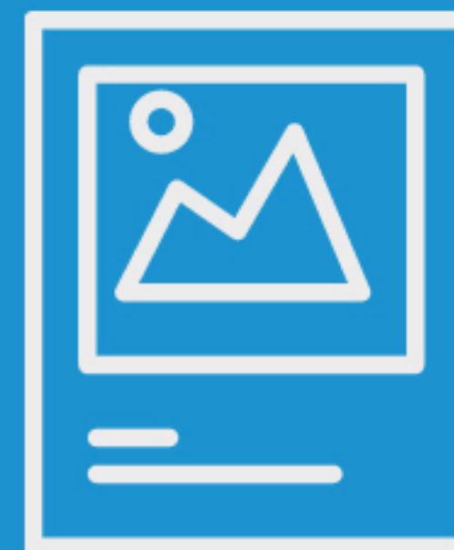
IMAGEM É TUDO

49.727 reações, comentários e compartilhamentos